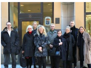
Foto från mötet med tre ministrar den 16 mars.