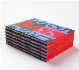
KLYS jubileumsbok

I samband med KLYS 60-årsjubileum 2019 lät KLYS ta fram en särskild jubileumsbok, KLYS 1959-2019 , med en överblick över KLYS sex decennier och hur KLYS ser på framtiden. Uppdraget som författare och redaktör av boken gick till journalisten och författaren Thord Eriksson. Formgivningsuppdraget gick till formgivningsbyrån Ateljé Grotesk. Boken finns att beställa på KLYS kansli.