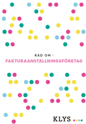
Broschyren "Råd om: Fakturaanställningsföretag"