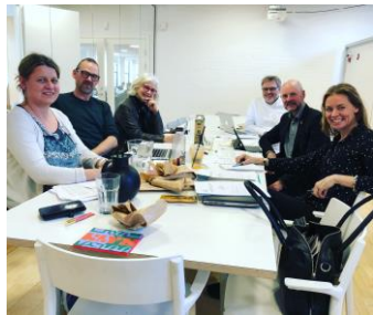
Bild från Nordiska konstnärsrådets möte i Köpenhamn den 17 februari.

KLYS är sedan tio år tillbaka medlem i det världsomspännande nätverket IFCCD – International Federation of Coalitions for Cultural Diversity. KLYS deltog genom sin verksamhetsledare vid IFCCD:s europeiska gren ECCD:s årsmöte i Paris den 10 februari i samband med Unescos IGC-möte (intergovernmental committée) den 11-14 februari om Unescos mångfaldskonvention från 2005.