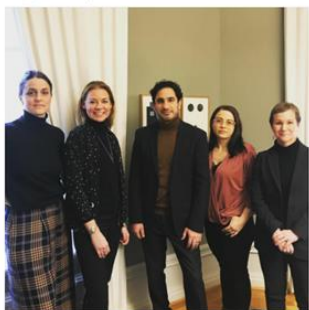
Foto från mötet med Socialförsäkringsminister Ardalan Shekarabi den 26 februari.

Pandemin har blottlagt kulturskapares problem i socialförsäkringssystemen. KLYS har därför under året träffat både socialförsäkringsministern Ardalan Shekarabi och arbetsmarknadsminister Eva Nordmark..