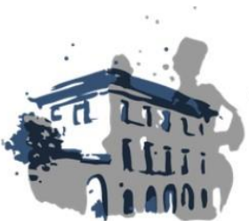
Circolo Scandinavo- Skandinaviska Föreningens Konstnärshus i Rom